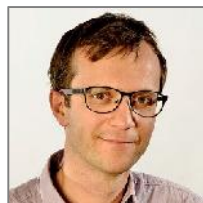
Dr. Juri Haas Grundschule (Lehrer- Hauptpersonalrat)