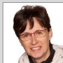
Steffi Groß Schiller-Gymnasium Bautzen